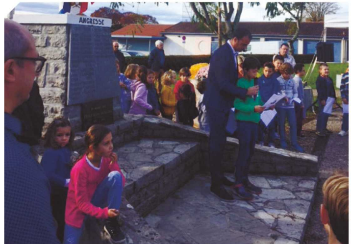
Lecture de lettres de poilus par les écoliers.

Certains d'entre eux lurent des lettres de poilus : l'évocation de destins aussi dramatiques dans la bouche de jeunes enfants fit frissonner toute l'assistance. Et l'on peut penser que leur implication dans ce type de manifestation et la force des mots qu'ils prononcèrent aura une grande valeur éducative.