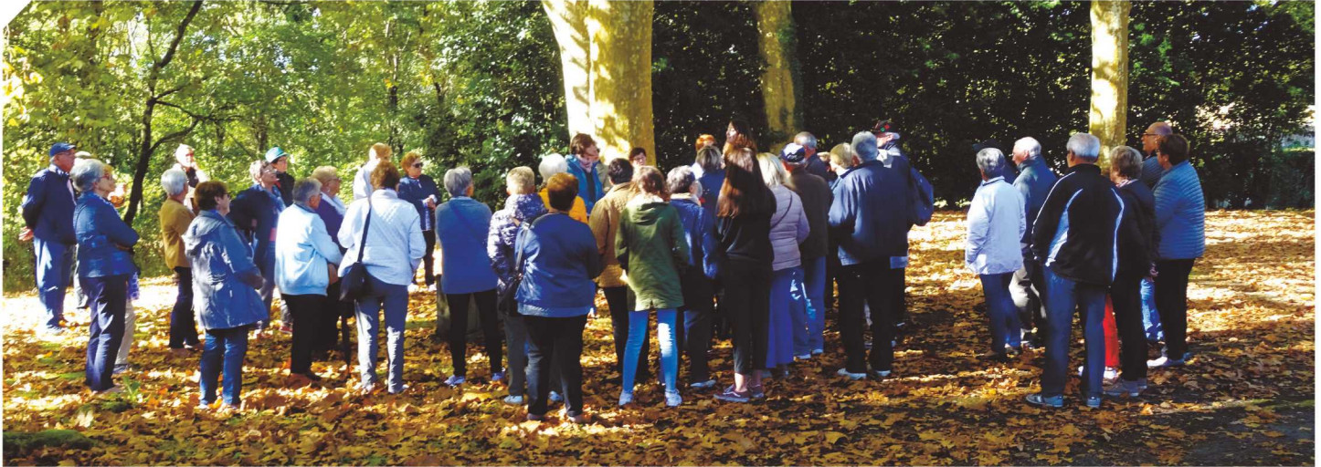
Les 3A à Navarrenx.

C'est toujours deux fois par semaine, le mardi et vendredi après-midi, que nous nous retrouvons dans notre jolie salle des 3 A pour partager divers jeux de société (belote, tarot, scrabble etc....) mais pour partager aussi le bon goûter offert par le club et tout cela dans une ambiance très amicale.