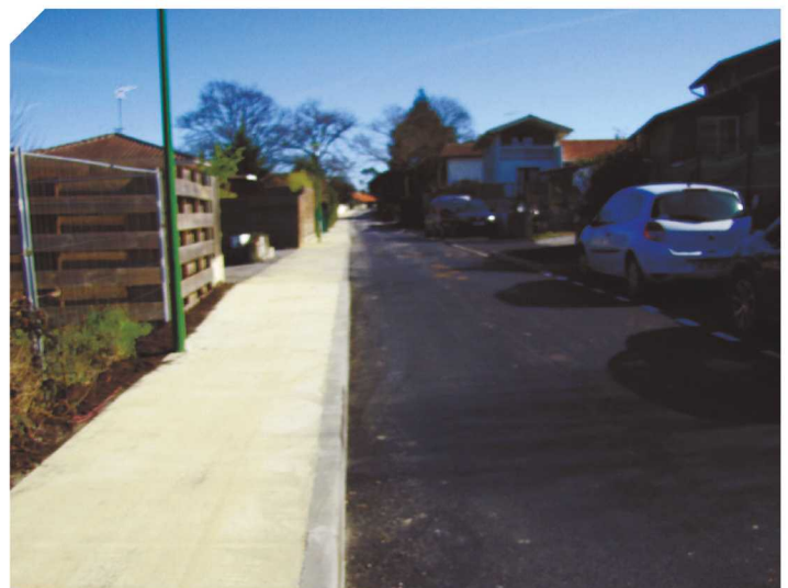
Le chemin de Lagroune désormais en sens unique.

L'ensemble de ces investissements représente un coût total hors taxe s'élève à plus de 450 000 €.