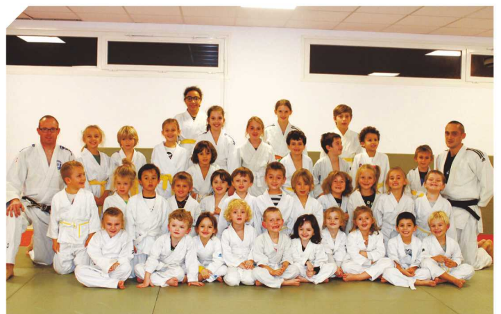
L'école de judo d'Angresse.

Le 21 décembre a eu lieu le Noël du judo, soirée au cours de laquelle les plus jeunes d'Angresse et de Capbreton