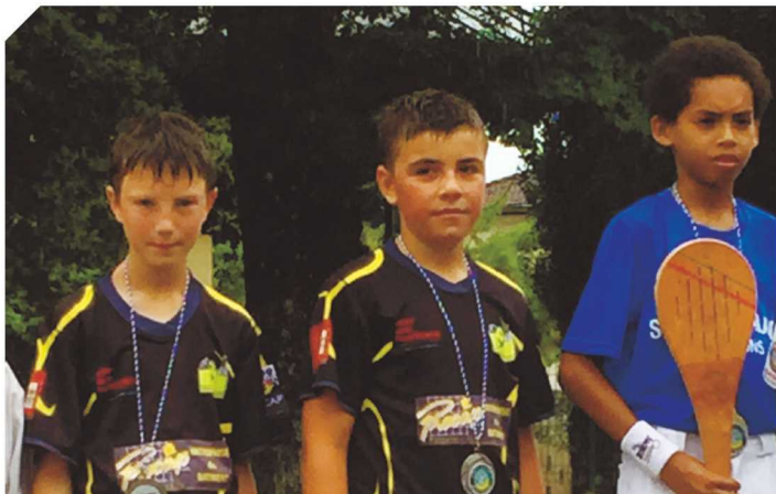
Paleta gomme 2018.

Plusieurs fois champions des Landes, de France et