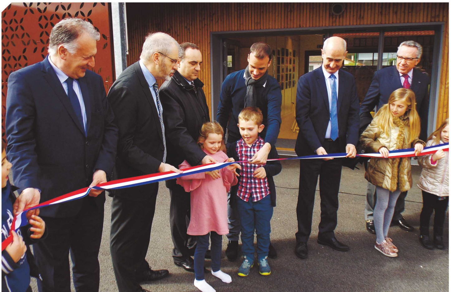
Inauguration de l'école.

La convention de mise à disposition de ces moyens supplémentaires a été signée par l'Education Nationale.