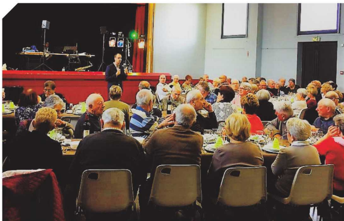
Le repas des anciens.

Le samedi 10 novembre 2018 comme tous les ans, le CCAS d'Angresse a offert à tous les anciens de plus de 70 ans de se retrouver pour un moment convivial, dans la salle des fêtes préparée pour l'occasion par les élus.