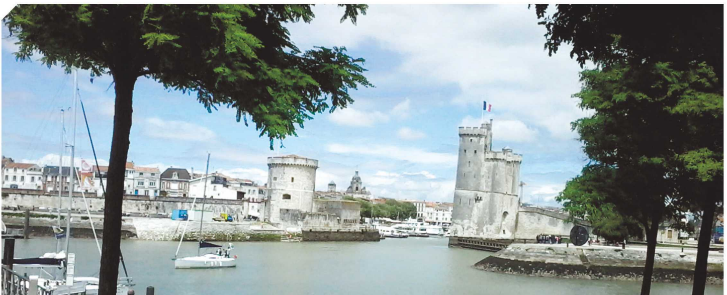
Les 3A à La Rochelle.